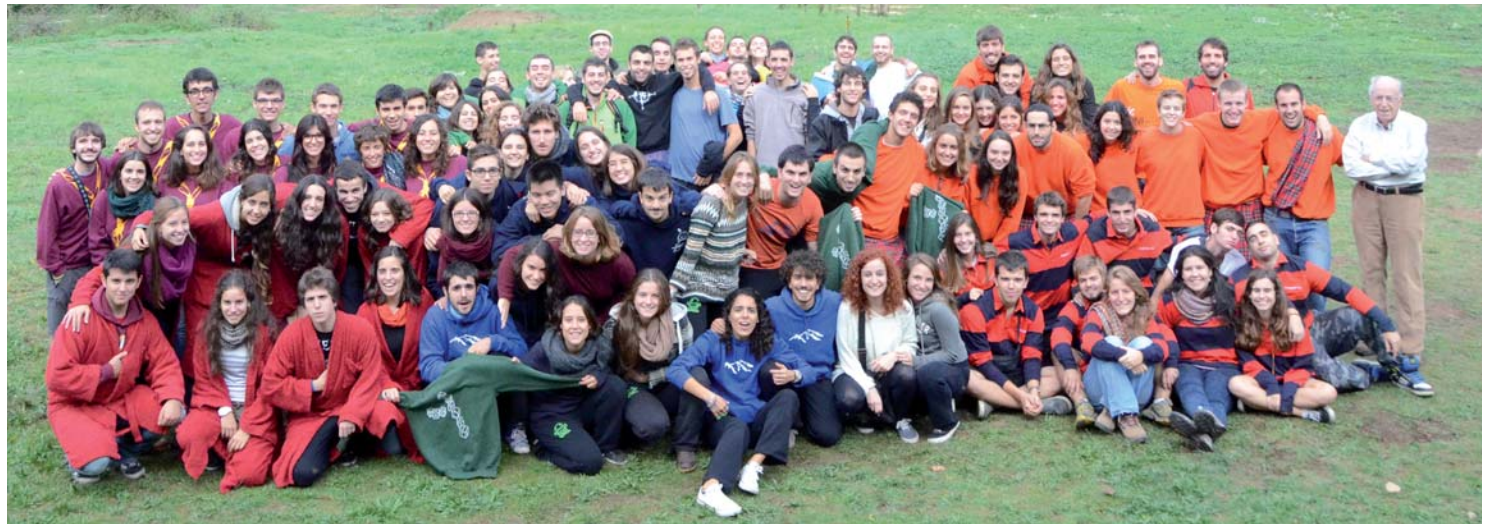
Cloenda del curs a Viladrau amb tots els monitors (5 d'octubre 2013).

Després d'un curs carregat de nous reptes amb iniciatives molt ambicioses, tots els membres del GCCC esperàvem el passat juliol que els 546 infants, adolescents i joves que ens endúiem de colònies i de campaments gaudissin d'unes activitats ben preparades, amb l'objectiu d'ajudar-los a créixer, de transmetre'ls uns valors alhora que els fèiem passar uns dies inoblidables en un entorn inigualable.