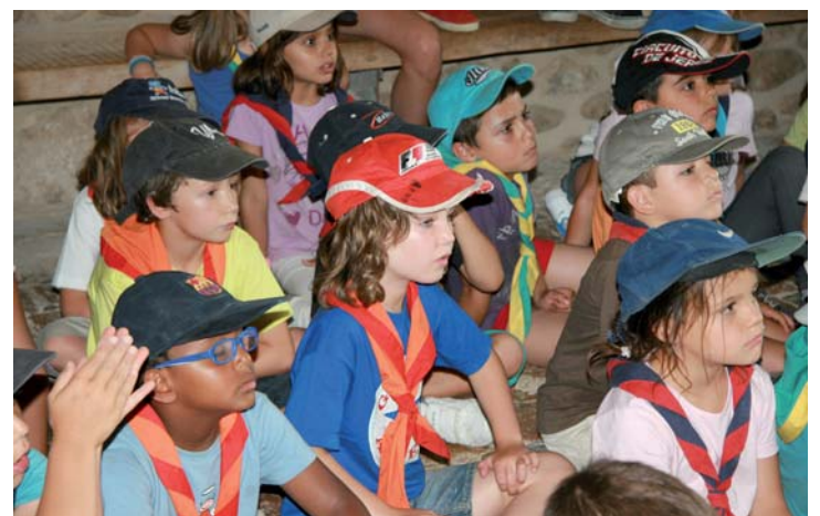
Els més menuts, a Can Què, escolten amb atenció als monitors.

A JESUÏTES CASP ACOLLIREM L'EXPOSICIÓ H2020 DEL 20 AL 26 DE NOVEMBRE