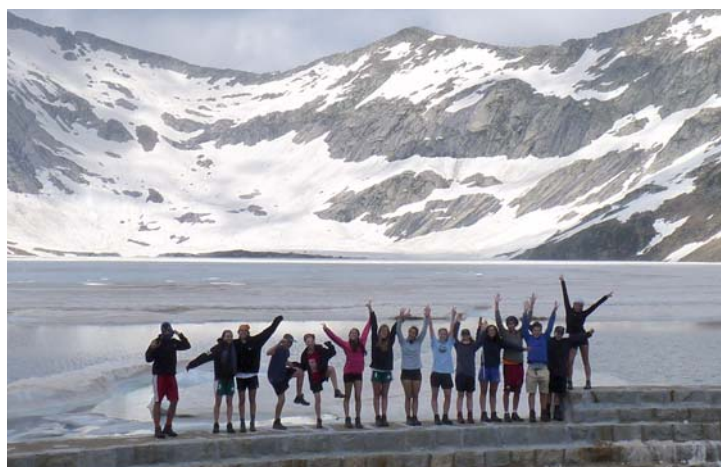
Els grans exploren els indrets més inhòspits del Pallars Sobirà.

Responsable del Grup de Colònies i Campaments Casp GCCC